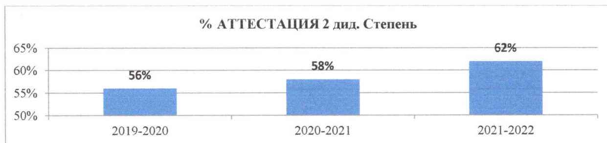
Диаграмма показывает увеличение количества аттестуемых педагогов (за последние 3 года на 6%).

Данные по аттестации менеджеров показывают снижение аттестованных руководителей по причине проведения конкурсов на замещение вакантных должностей директоров и обновления менеджерского состава детских садов.