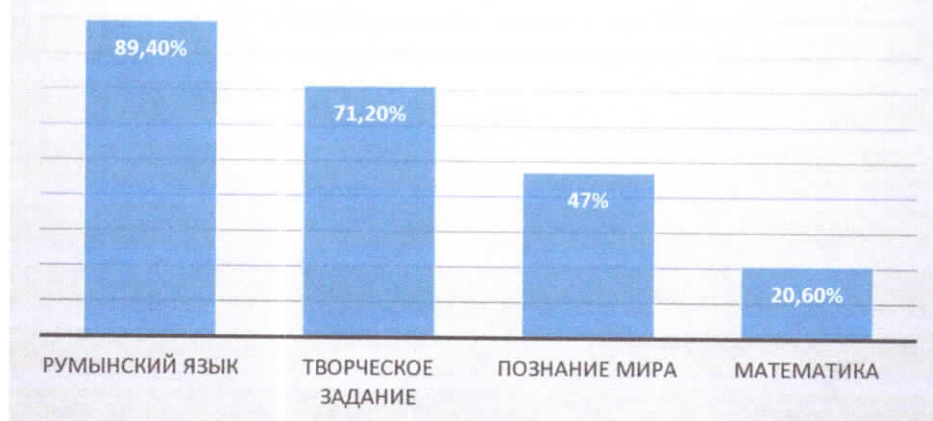
Диаграмма по предметам.