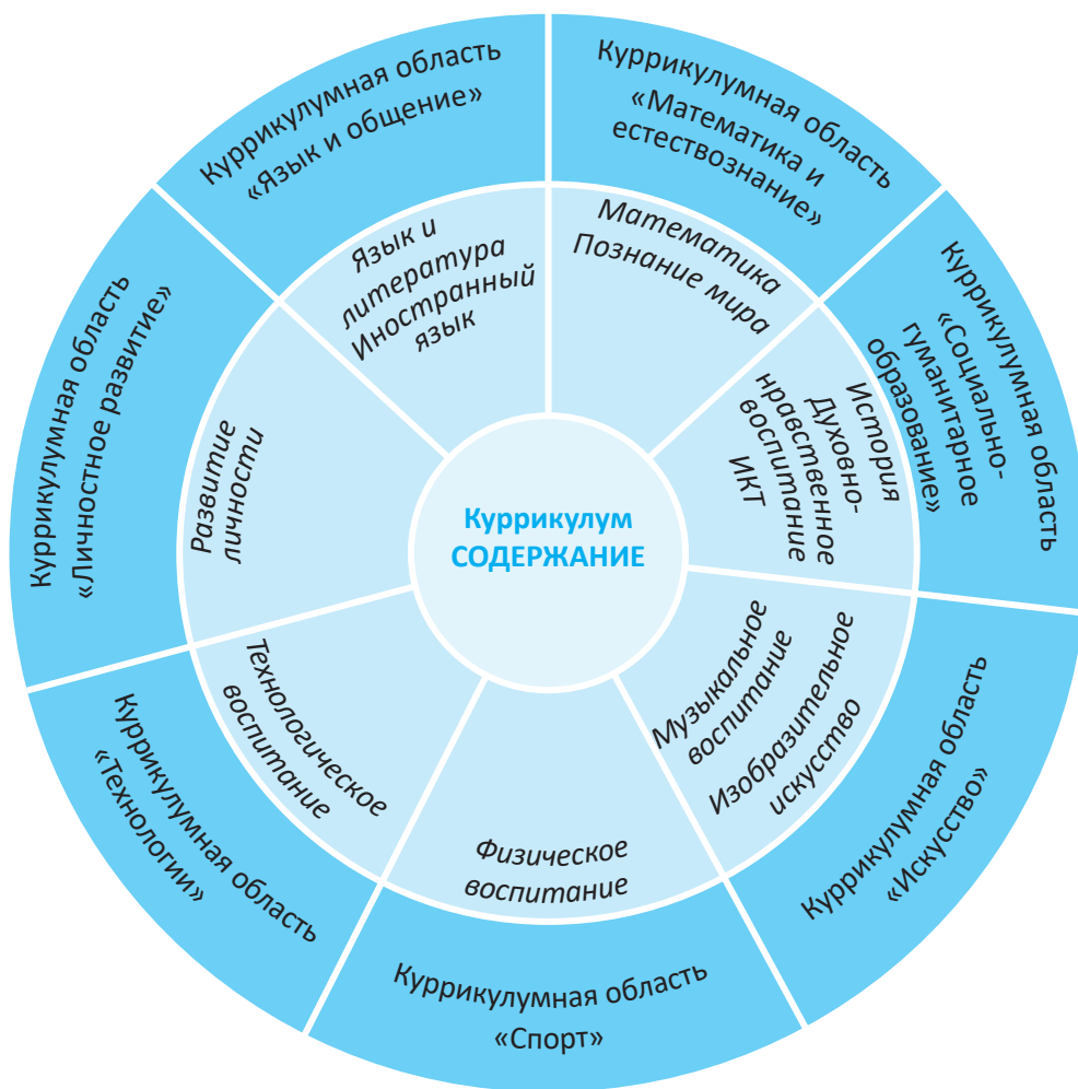
Фигура 2. Система учебных содержаний куррикулума для начального образования

Система учебных содержаний куррикулума для начального образования (в широком смысле), структурирована по куррикулумным областям и учебным дисциплинам, предназначенным для обеспечения формирования компетенций. Предметное содержание (в узком смысле) включает знания (теории, законы, закономерности, факты, феномены, процессы, данные и т.д.) и человеческие ценности .